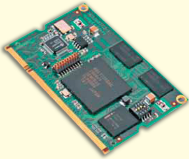
Рисунок 2 Внешний вид SODIMM модуля фирмы Emtrion, партнера компании Renesas